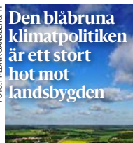
Den blåbruna klimatpolitiken är ett stort hot mot landsbygden