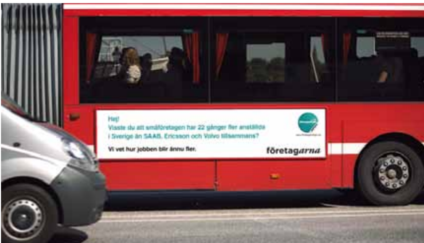
10 Så lyfte vi företagarfrågorna inför valet 2010.