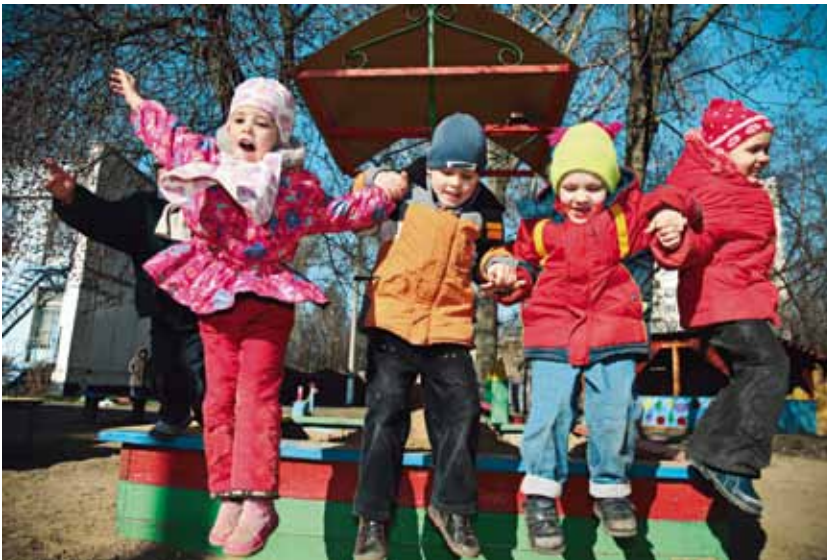
20 Valfärd för framtiden.