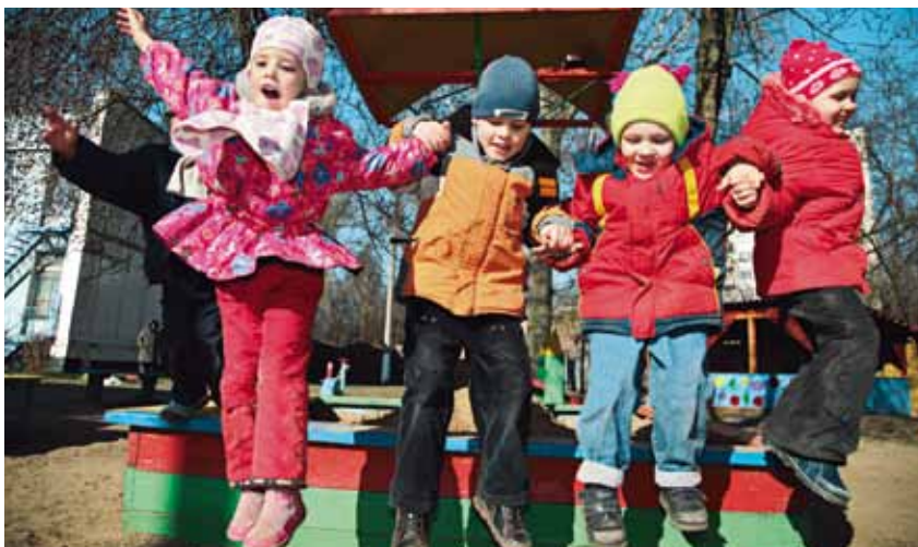
Välfärdsföretagen skapar nya möjligheter för framtiden.

Konkurrens från offentlig sektor drabbar små företag som verkar lokalt. En rapport från Företagarna 2008 visar att drygt vart sjätte småföretag – eller i konkreta siffror 33 000 företag – upplever konkurrens från offentlig sektor.