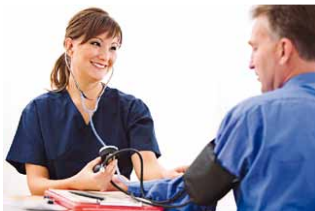
21 Trygghet på företagares villkor.