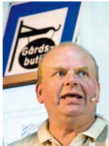
Jordbruksminister Eskil Erlandsson, C, deltog i Företagarnas engagerade paneldebatt om matlandet Sverige i Almedalen.