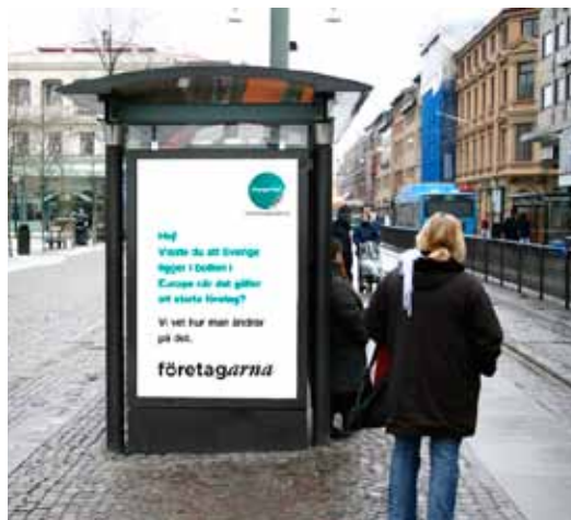
Företagarna hade ett intensivt kampanjår under 2010 med stora synliga kampanjer på gator och torg i landet.