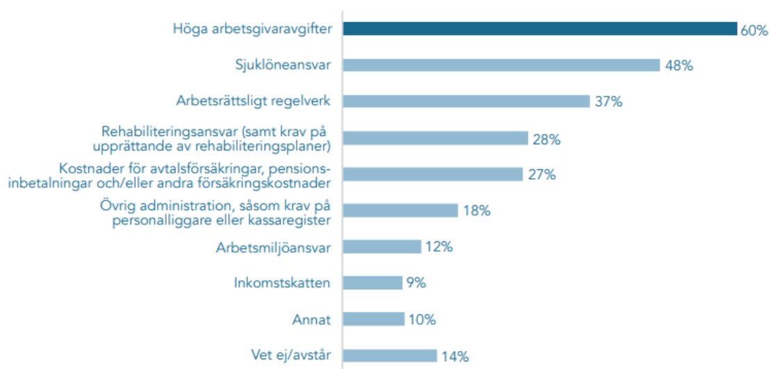
FIGUR 2.1 VILKA AV FÖLJANDE FAKTORER ANSER DU GENERELLT ÄR DE STÖRSTA HINDREN FÖR FÖRETAG SOM VILL NYANSTÄLLA OCH EXPANDERA?

Sjuklöneansvaret är det näst största hindret för företag att anställa och expandera, enligt en undersökning presenterad av Entreprenörskapsforum (se figur 2.1 nedan). 6 Bland företagare som uppger att de vill anställa uppger två av tre att sjuklöneansvaret inverkar negativt på deras benägenhet att anställa. 7