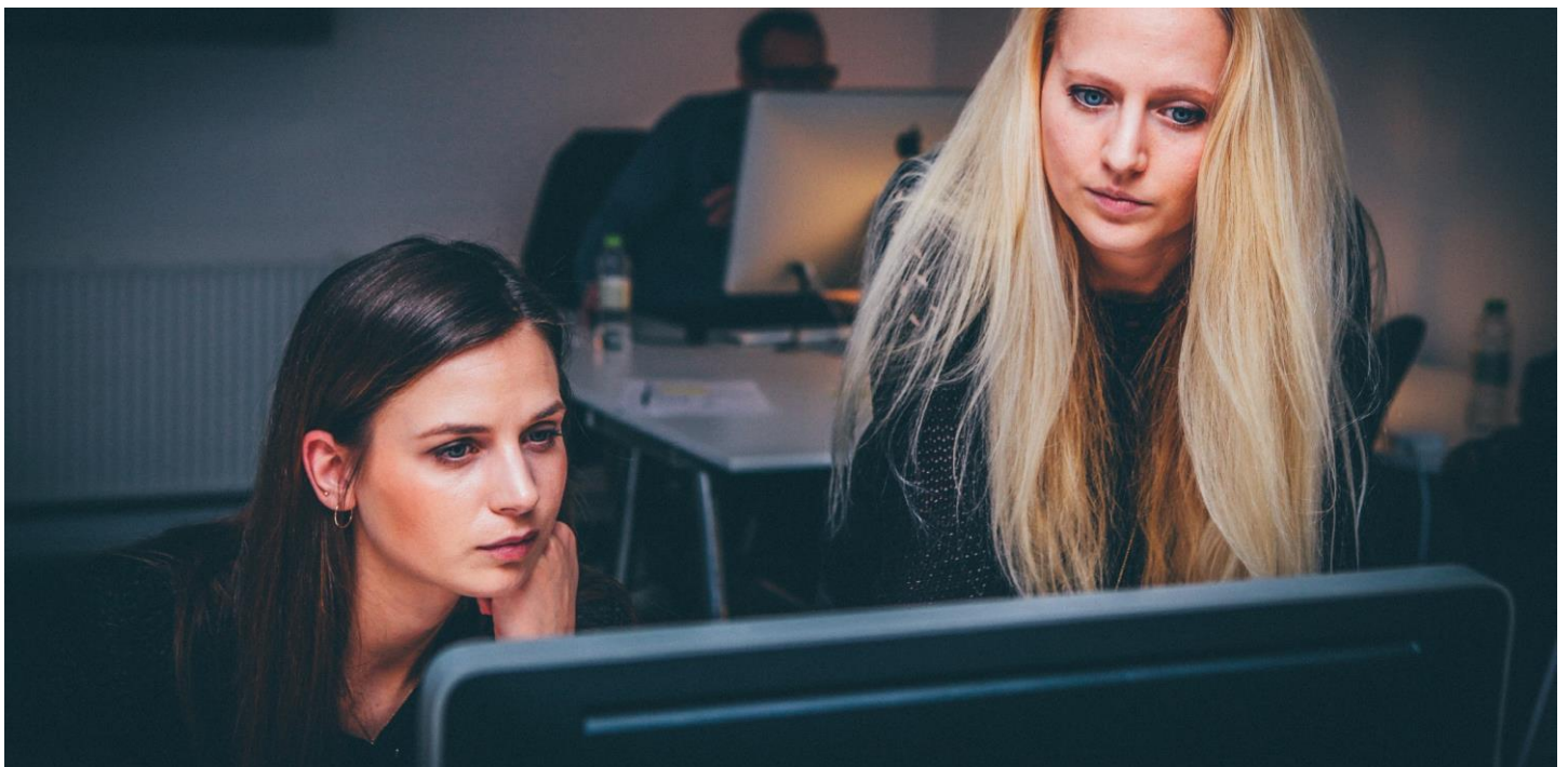
Andel av kommunala skatteintäkter per sektor, Götene kommun